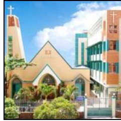
HT Khánh-Hội, SG.VN