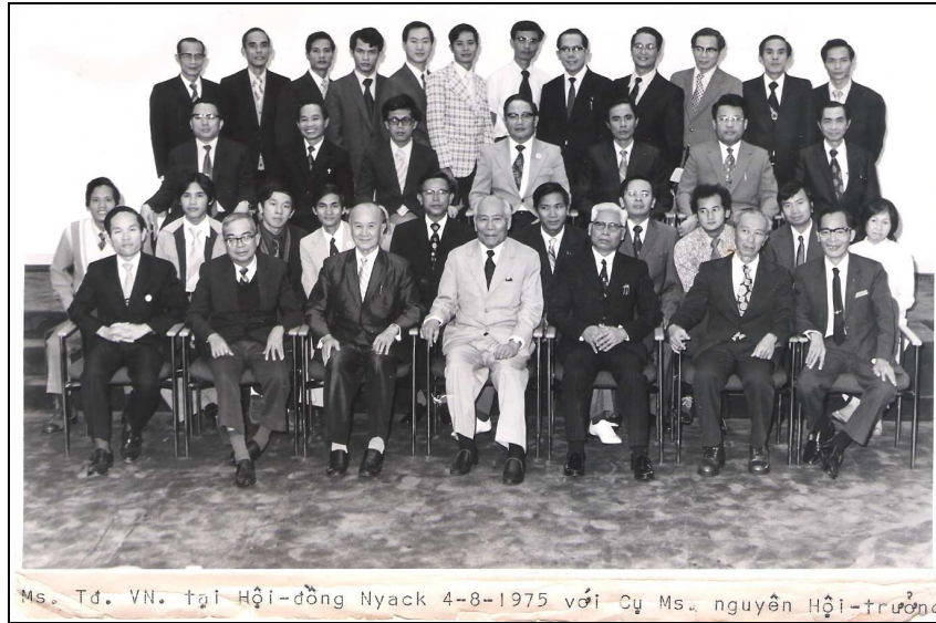
Ms. Tđ. VN. tại Hội-đồng Nyack 4-8-1975 với Cy Ms. nguyên Hội-trưởng