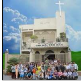
HT Tôn-Đản, SG.VN