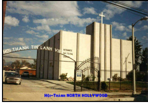
HT North Hollywood, CA. USA