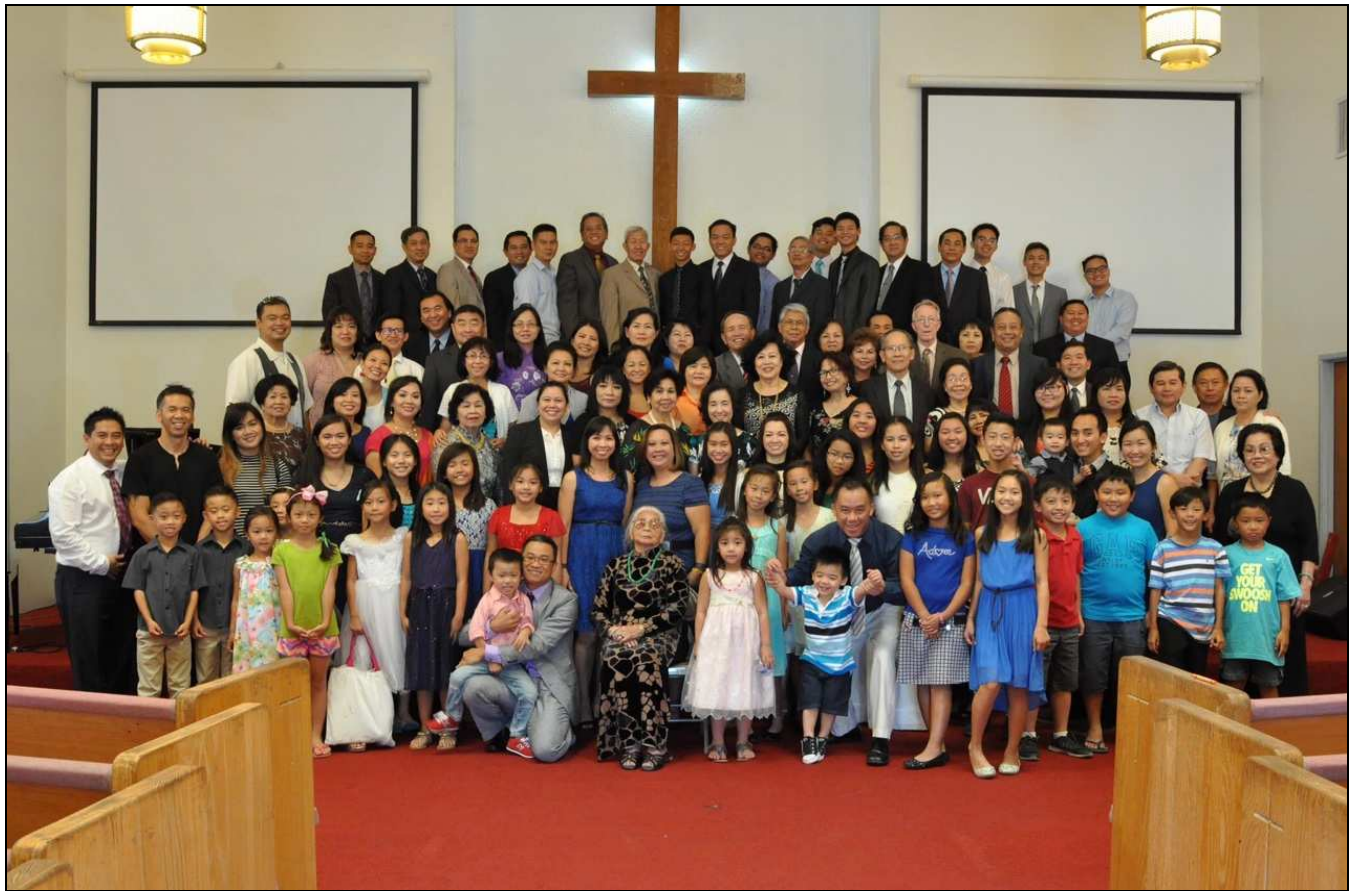
Hội Thánh NORTH HOLLYWOOD California, USA